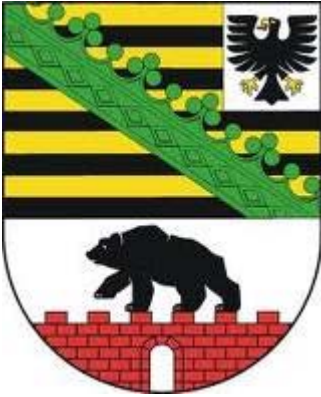
Wappen Land Sachsen-Anhalt