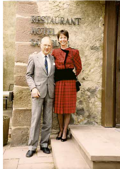
am 01.Mai 1987 auf der Sababurg bei Hofgeismar