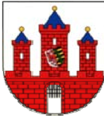
Wappen Stadt Harzgerode