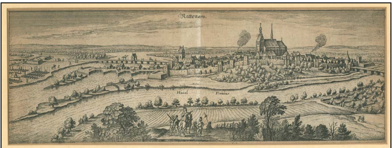
Rathenow um 1652 • Geburtsort von Waldtraud Schwarze VIII.2 Kupferstich von Matthäus Merian • Originalgröße: 35,5 x 13,5 cm