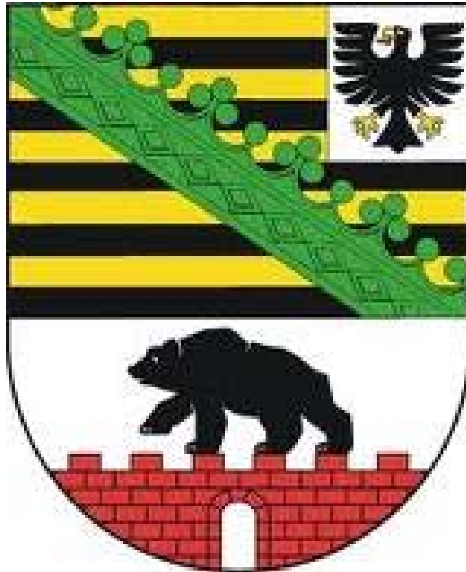
Wappen Sachsen-Anhalt Oben: Preußische Provinz Sachsen • Unten: Freistaat Anhalt